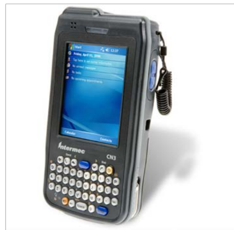
Intermac CN3 series