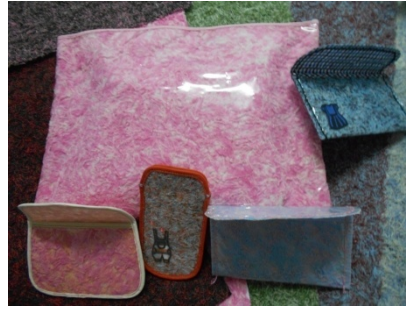
กระดาษรีไซเคิล