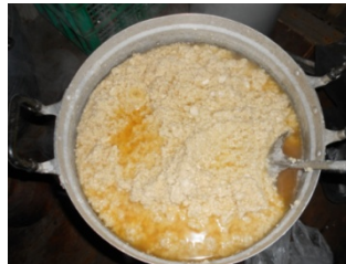
ภาพที่ 1 การนำกระดาษชิ้นเล็กไปแช่น้ำ ขยี้กระดาษแล้วต้ม ใส่โซดาไฟ