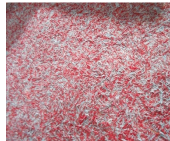
ภาพที่ 5 ผึ่งให้แห้งและลอกออก จะได้ ด้ายแผ่น