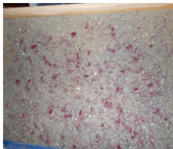
ภาพที่ 3 เยื่อกระดาษผสมกับเศษด้าย ใส่บล็อกเทน้ำสะอาดให้สูงกว่าบล็อก