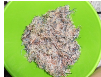
ภาพที่ 4 เศษด้ายผสมกาวลาเท็กซ์ เกลี่ยบนแผ่นพลาสติก