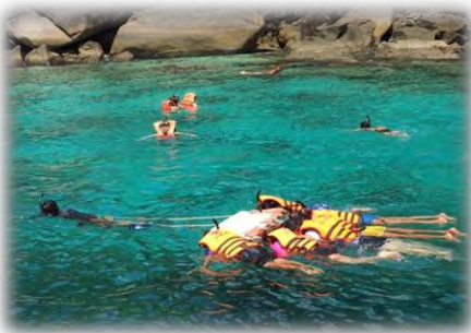
รูปที่ 6 นำอุปกรณ์ทดลองใช้จริง