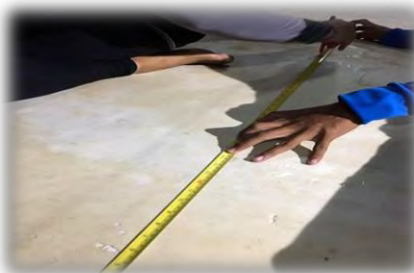
รูปที่ 2 วัดขนาดอุปกรณ์ที่ต้องการตัด