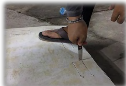
รูปที่ 4 เจาะอุปกรณ์เพื่อสำหรับเป็นที่จับของนักท่องเที่ยวนักดำน้ำ