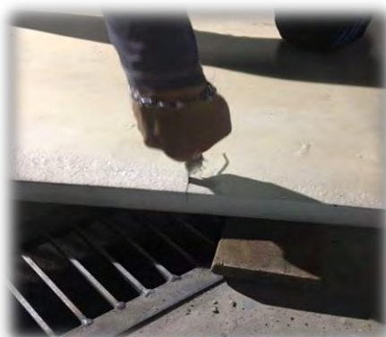
รูปที่ 3 ตัดแผ่นอุปกรณ์ตามขนาดที่ต้องการ