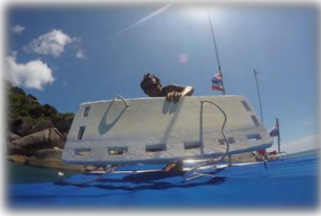
รูปที่ 5 อุปกรณ์เสริมสมบูรณ์